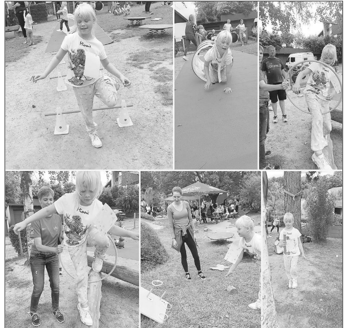
Die Kinder konnten beim Zirkusparcours ihre Geschicklichkeit und Bewegungsfähigkeit testen.