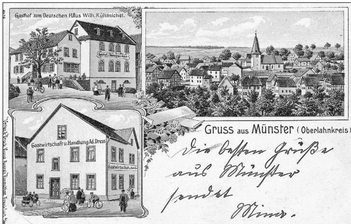
historische Postkarte aus Münster